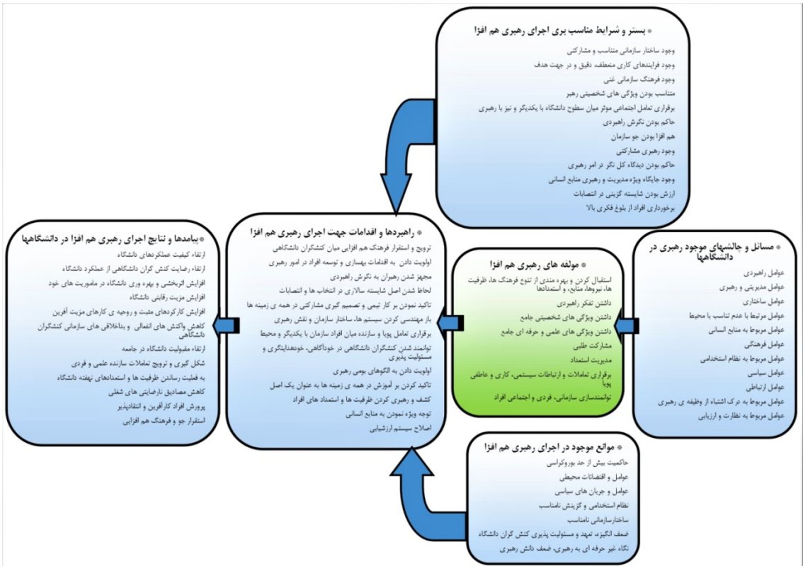
شکل (۲): الگوی پارادایمی رهبری هم افزا برای دانشگاههای ایران