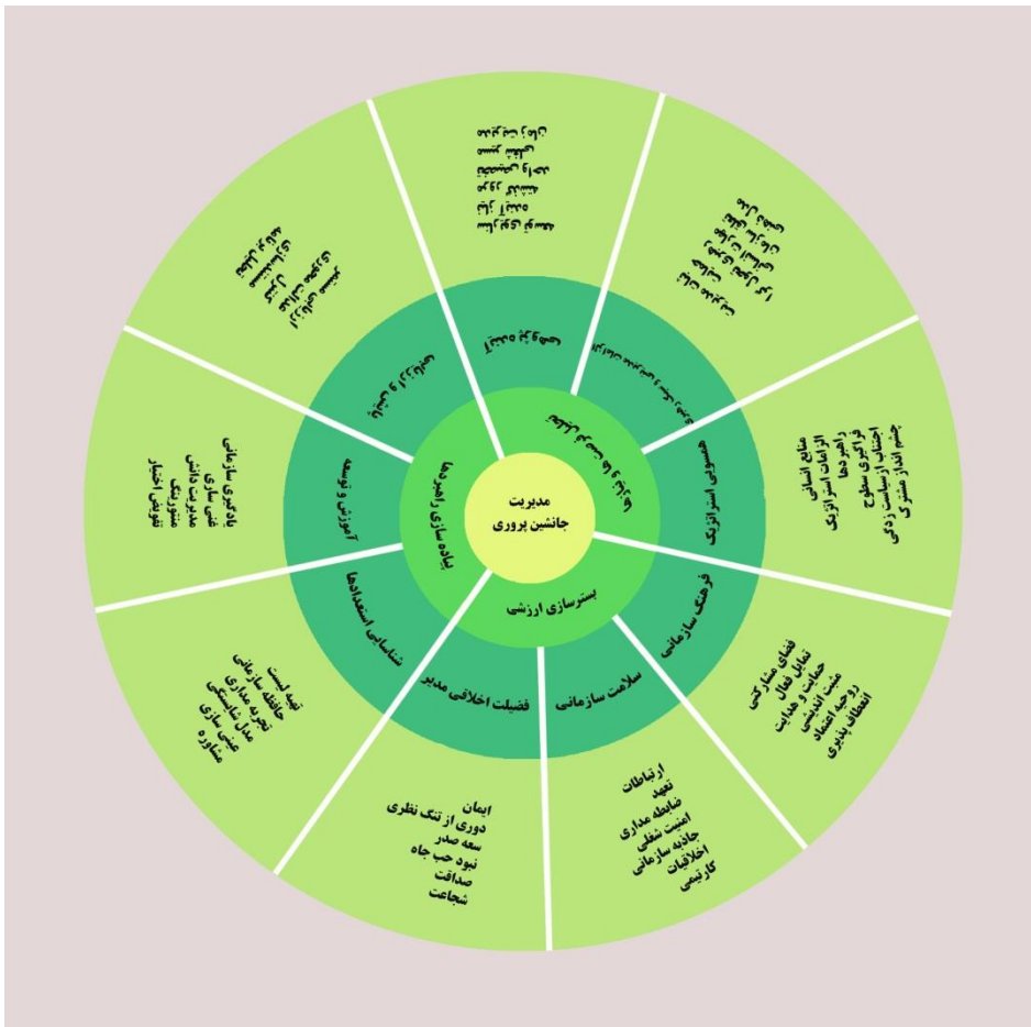
شکل ۲. مدل نهایی مدیریت آماده‌سازی جانشین در کانون پرورش فکری کودکان و نوجوانان

۲. الزامات مدیریتی و سبک رهبری، ۳. همسویی استراتژیک، ۴. فرهنگ سازمانی، ۵. سلامت سازمانی، ۶. رضایت اخلاقی مدیر، ۷. شناسایی استعدادها، ۸. توسعه و آموزش و ۹. پایش و ارزیابی بوده است. نتایج بخش کمی نشان داد که تمامی ابعاد، مولفه‌ها و شاخص‌های مدیریت آماده‌سازی جانشین در سازمان مورد مطالعه، مورد تأیید هستند.