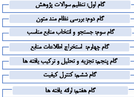
شکل ۱: مراحل هفت گانه روش کیفی فراترکیب (سندلوسکی و باروسو، ۲۰۰۷)

روش از یک الگوی هفت مرحله‌ای برای تحلیل اسناد استفاده می‌کند. در شکل ۱ مراحل هفت گانه این الگو نشان داده شده است: